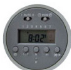
Цифровой недельный программируемый таймер