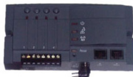
Блок управления по телефону