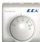
Комнатный термостат (on/off)