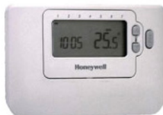
Цифровой Комнатный Термостат с недельным программатором